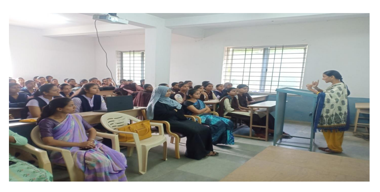
A Talk on Legal rights of women