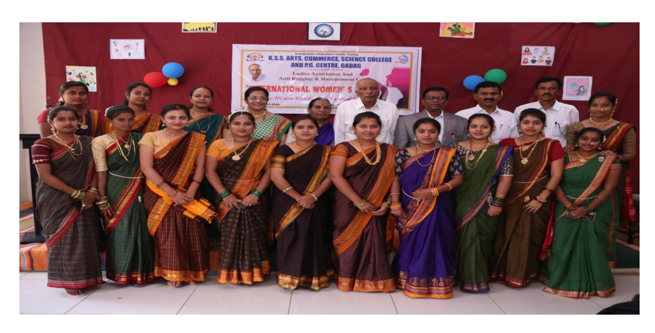
Health awareness programs for women